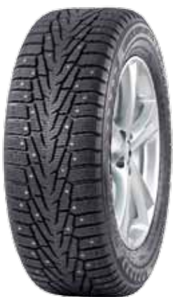
Nokian Hakkapeliitta 7 SUV