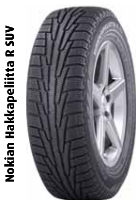
Nokian Hakkapeliitta R SUV

* suunniteltu Keski-Euroopan talviolosuhteisiin