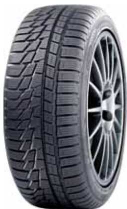
Nokian WR G2