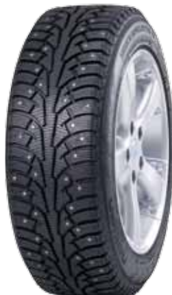
Nokian Hakkapeliitta 5