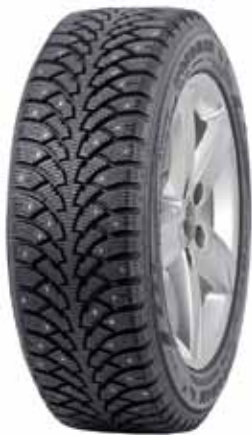
Nokian Nordman 4