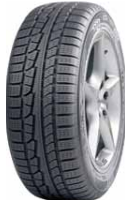
Nokian WR G2 SUV