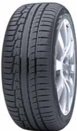
Nokian WR A3

* suunniteltu Keski-Euroopan talviolosuhteisiin