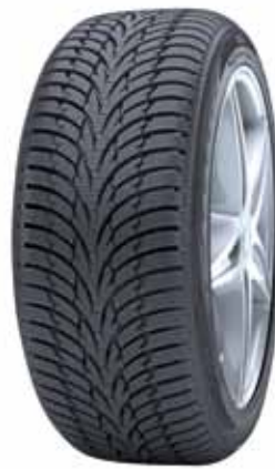
Nokian WR D3