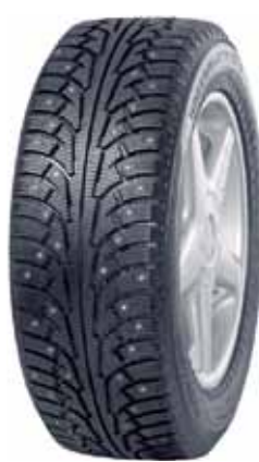
Nokian Hakkapeliitta SUV 5